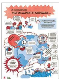
L'alimentation durable Cycles 2 à 3