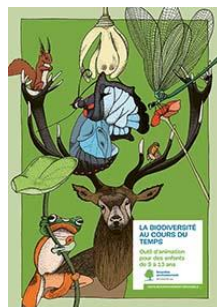
La biodiversité au cours du temps Cycles 2 à 3