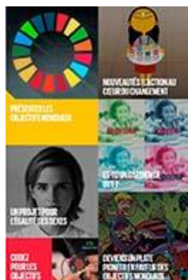
La plus grande leçon du monde Cycles 2 à 3