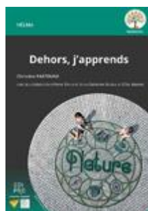
Dehors, j'apprends Tous les cycles