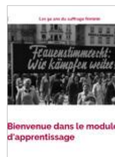
Les 50 ans du suffrage féminin Cycle 3, Sec. II