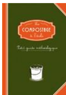
Le compostage à l'école Tous les cycles