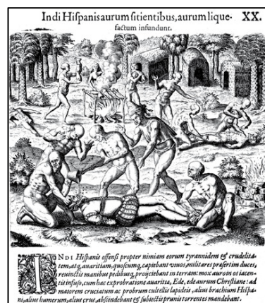
Gravure de Théodore de Bry

A noter que l'appétit des Espagnols pour l'or est aussi incompréhensible pour les Indiens que le cannibalisme pour les Européens. On voit là un bel exemple d'incompréhension culturelle réciproque ! À la même époque se diffuse la légende de l'Eldorado 3 . Pendant de nombreuses années, des explorateurs européens partirent à la recherche de l'Eldorado mais sans succès.