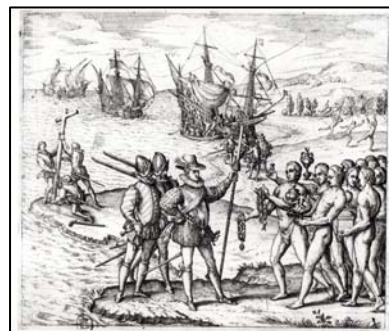
Gravure de Théodore de Bry

Le 3 août 1492, Christophe Colomb quitte l'Andalousie, à la tête de trois caravelles (la Niña, la Pinta et la Santa María) et 90 membres d'équipage. Après une escale aux îles Canaries, l'expédition se lance dans une traversée qui va durer 36 jours. Les caravelles débarquent le 12 octobre sur l'île de Guanahani dans les Bahamas actuelles. Le navigateur est convaincu d'avoir atteint les Indes. C'est pourquoi il baptise les hommes qui la peuplent "les Indiens". Les autochtones lui indiquent la présence d'or à Cuba. Il rejoint cette île le 28 octobre.