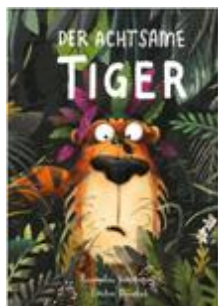
Der achtsame Tiger Zyklus 1