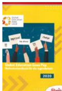
Global Education Goes Pop Ab Zyklus 3