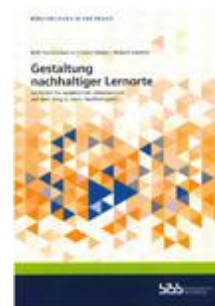
Gestaltung nachhaltiger Lernorte Ab Sekundarstufe II