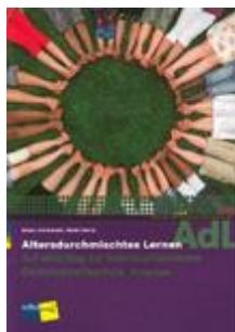
Altersdurchmisches Lernen Zyklus 1 und 2